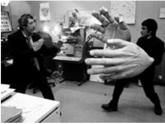
Science of sleep , Michel Gondry