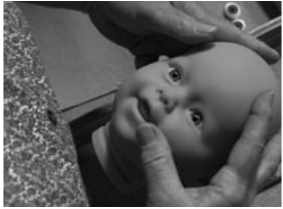
Bubble , Steven Soderbergh