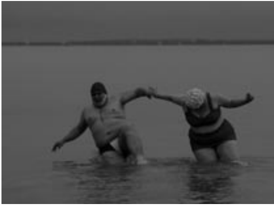
Taxidermia , György Pálfi